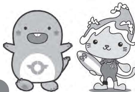
左：東金市マスコットキャラクター「とっちー」 右：九十九里町イメージキャラクター「くくりん」